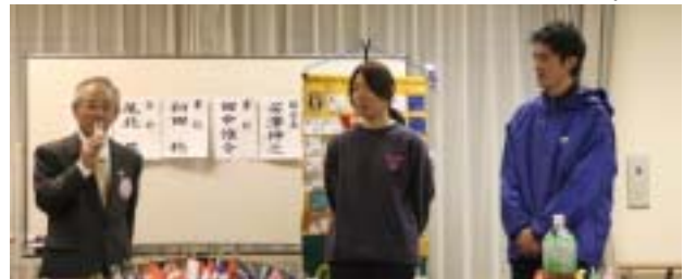
退任・転勤するスタッフへ激励の言葉をかける丸尾会長