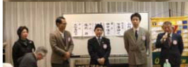
次期役員の方皆さん 次期一年間よろしくお祈りします。