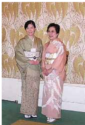
← いずれ牡丹か杜若