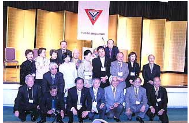
参加者の記念写真