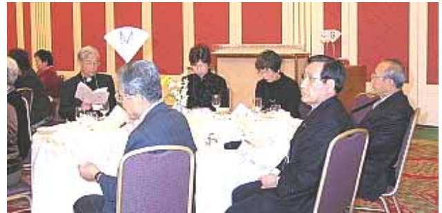
何が出てくるのか期待の皆さん