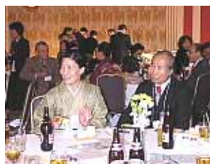
ごちそうさまです