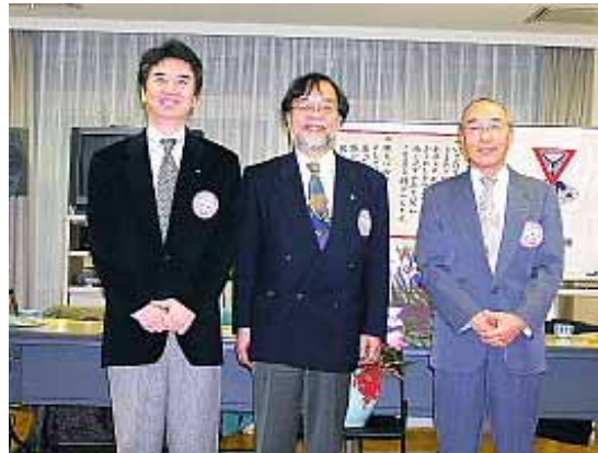
お揃いで記念撮影