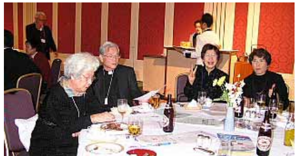
あぁ～、美味しかった。満足です。