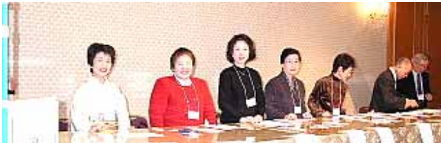
美人のお揃いでお迎え