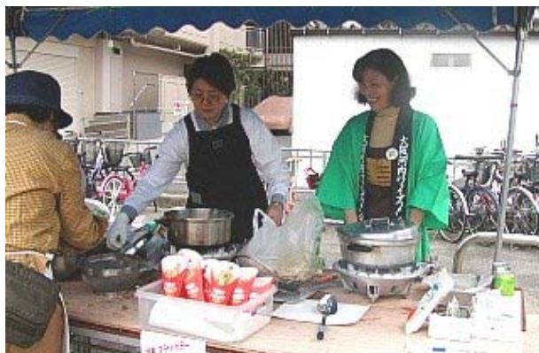
売り子もスタンバイ