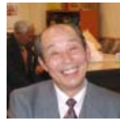
分団討議の報告をする各グループの座長