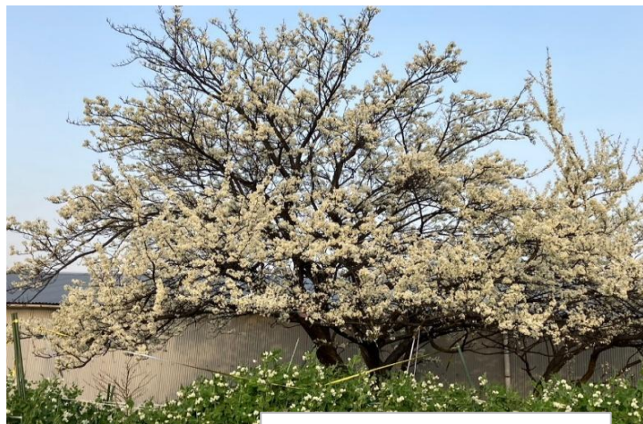
東大阪市 若江岩田にて