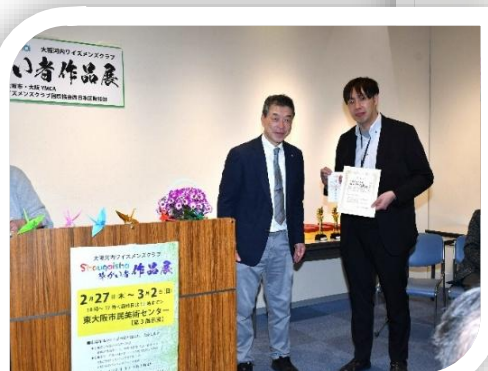
佳作 大阪府立たまがわ高等支援学校 モノづくり科産業基礎コース殿