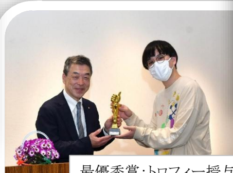
最優秀賞：トロフィー授与