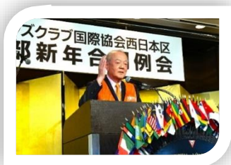
鉄谷実行委員長のご挨拶