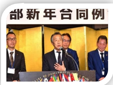
第27回西日本区大会(名古屋) 参加アピール是非ご参加を!