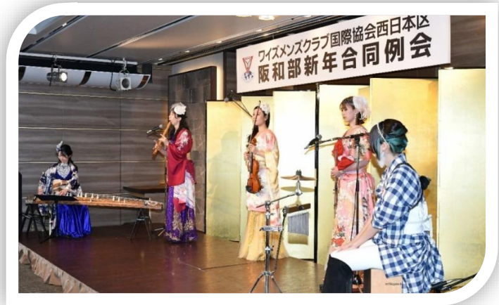
Women's Collection のみなさま