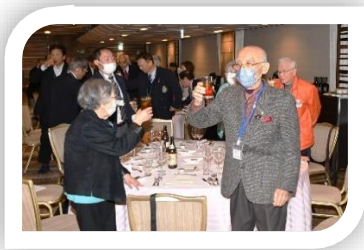
神谷ご夫妻の乾杯