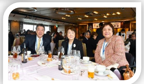
本年もよろしく お願いいたします。