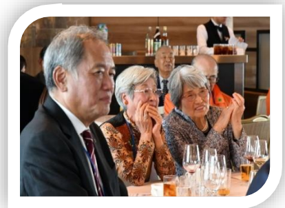
河内クラブ メネットさんと .....