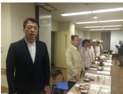
大阪河内ワイズメンズクラブ