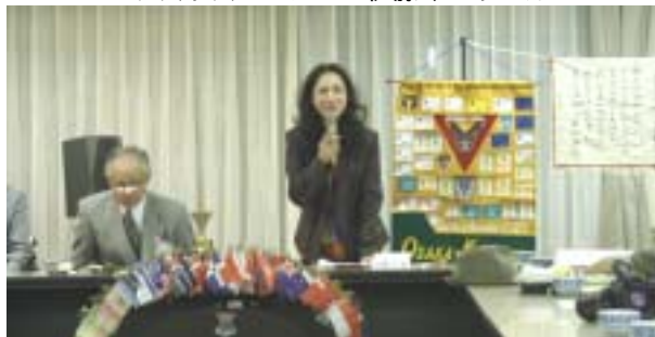
スピーチをされる伊藤みどりさん