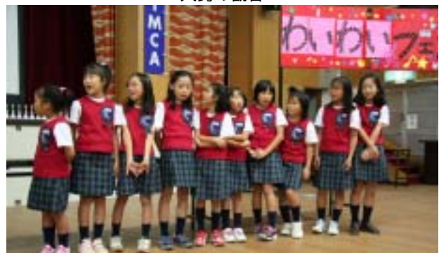
源氏ヶ丘小学校のハンドベルの皆さん