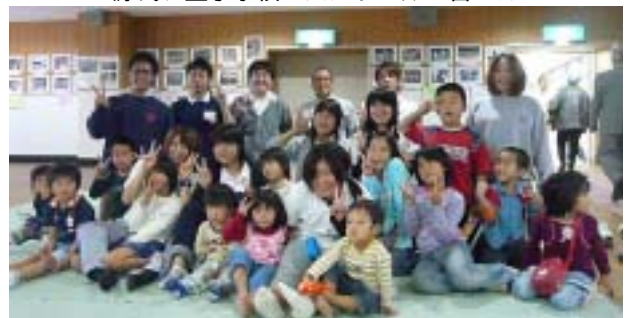
チビっ子も一緒に楽しみました