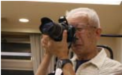
海外からの便り (抜粋)

英語力をカバーする意味で現場を言葉でなく、写真で表現するように英文ホームページを作る工夫をしている。