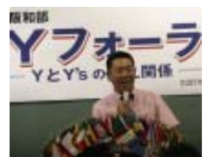
阿南海洋センター所長