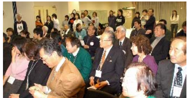
オークションに期待する参加者