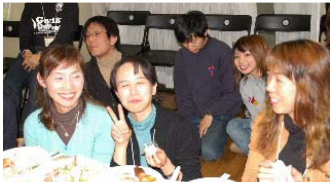
今日はお楽しみですか