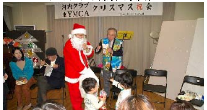
ワ～イ サンタさんだ