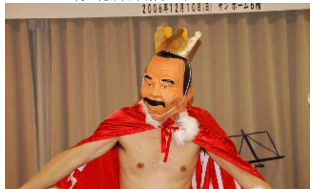
これは河内のメンバーではありません 断じて