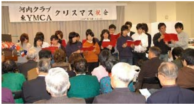
リーダーコーラス