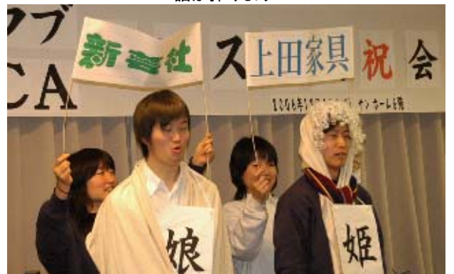
何で俺が姫や娘なんや・・・