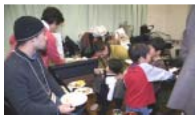
美味しいですか、満足ですか