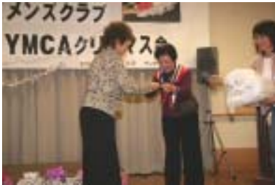
吉田さんアベックで入賞です。