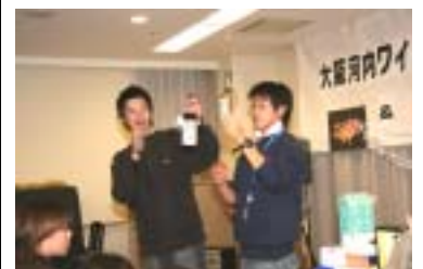
これは特別美味しいよ