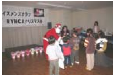
元気で親の言うことを良く聞いて