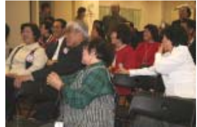
夫婦で競って大爆笑