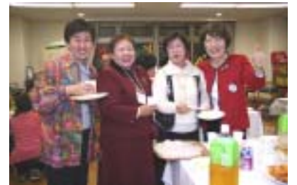
美人に撮ってね。ハイ・・・