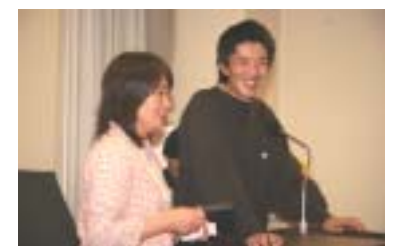
ツーショットで楽しそうだな

ご協力に感謝いたします。 この売上の中から 32000 円 を東YMCAへクリスマス献金として捧げます。