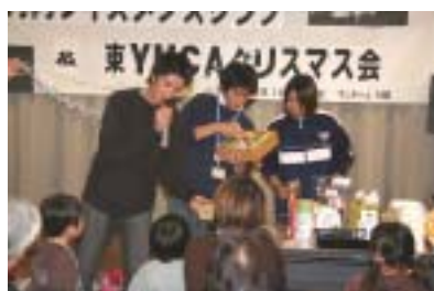
これなんぼで売ろうか・・・