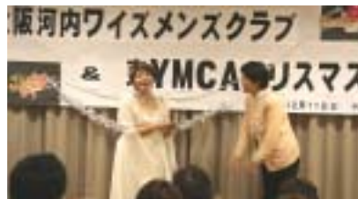
有り難うございました と横田会長