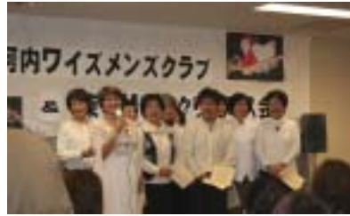
メネットコーラスの本番