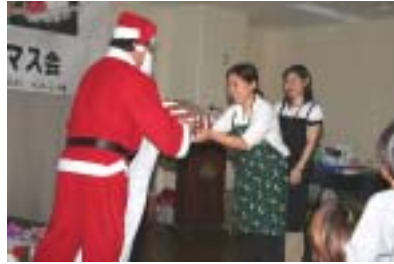
サンタからご馳走のお礼です