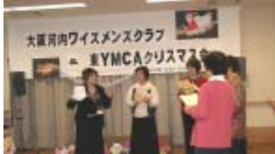
メネットコーラスの練習中