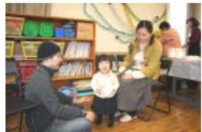
私は少し休憩です。