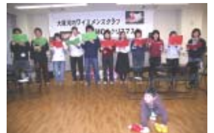
リーダーコーラス なぜか前に一人