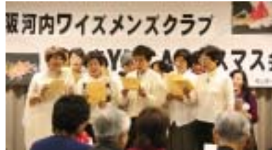
少しは様になっています