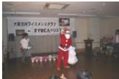
チビッコよってらっしゃい