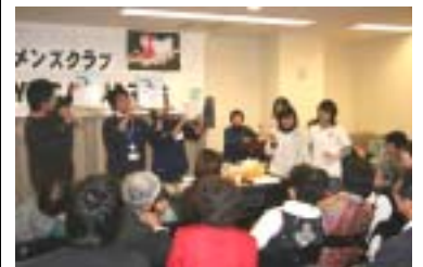
さあ~買って下さい