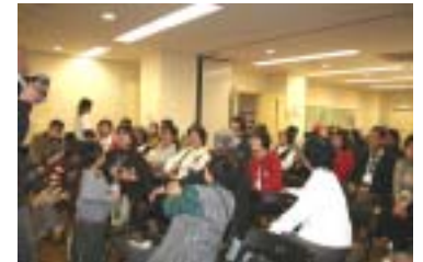
ハイ! ハイ! ハイ!.....