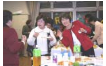
私も一緒に撮って・・・