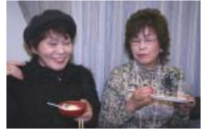
満足そうな笑顔はきっと美味しいですね