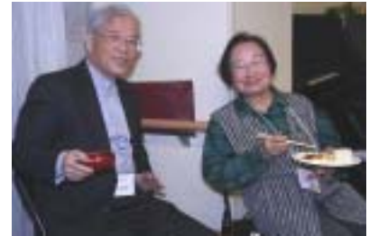
楽しそうなお二人