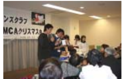
まだまだ沢山ありますよ