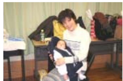
今年生まれたイエスです。