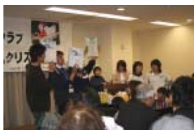
とにかく競ってください。