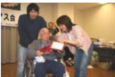
飯島さん良かったですね