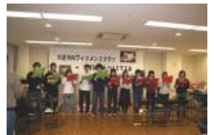
朝から練習したもんね。