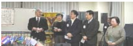
誕生日の皆さん おめでとうございます