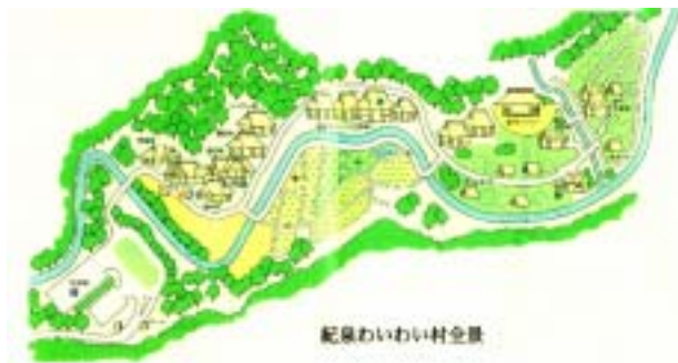
紀泉わいわい村全景

日時 2004年9月26日(日)現地集合 行き先 紀泉わいわい村 里山自然学校 会費 2000円 小・中学生は半額