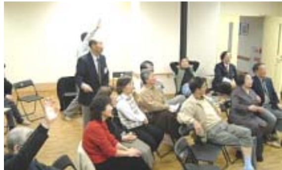
よっしゃ！それ買った！