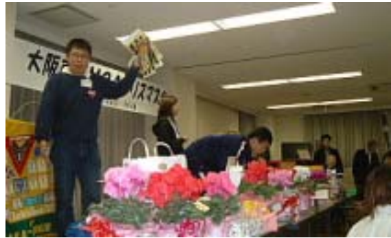
さあ～！高く買ってね！

沢山のお買い上げ有難うございます。 この売上の半分は東YMCAのクリスマス献金に捧げます。