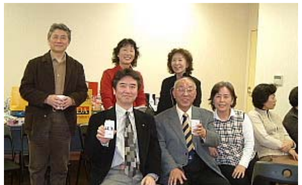
よくいらっしやいました。遠来のお客様