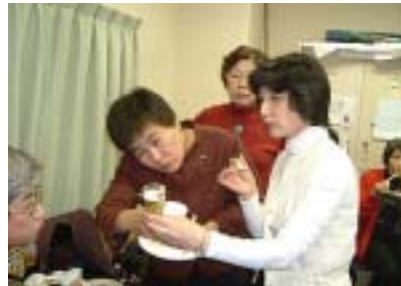
なにがなにしてなんとやら???