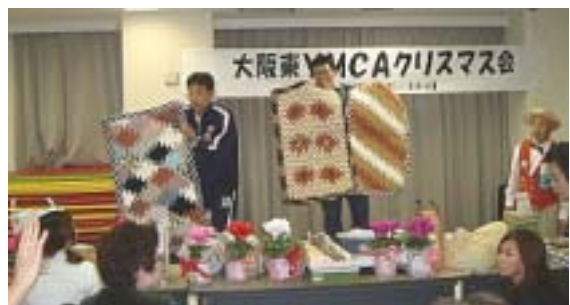
これは手作りです！他所には絶対ないよ