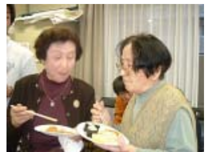
あらまあ~お久しぶりネ。積もる話も……

庭に果物のキウイを植えて20年になり、毎年50個ぐらい取れます。キウイは充分成熟した後に収穫し、しばらく休ませます。食べる前にリンゴ等他の果物と一緒にするとおいしくなります。人間の気の流れもこ