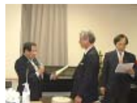
あなたは・増石委員長