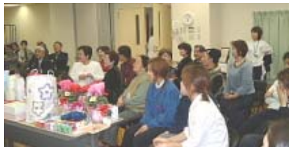
そこのお姉ちゃん声が出てないよ