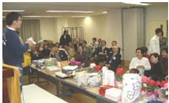
はよこおてえなあ ポク困っちゃう