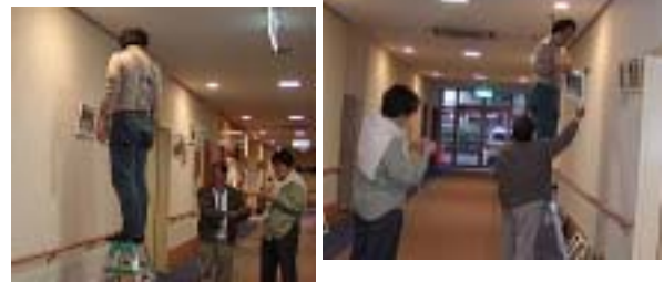
何処にどう展示しようかな