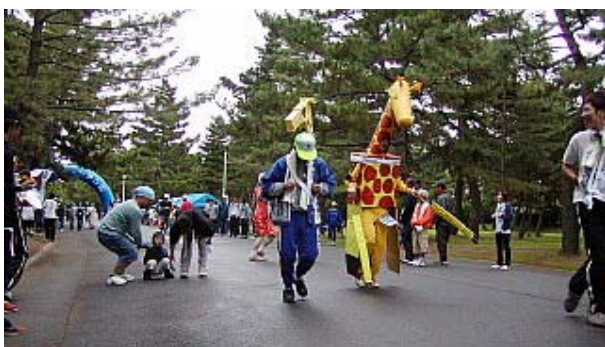
東YMCAの「河内キリン村」もスタート