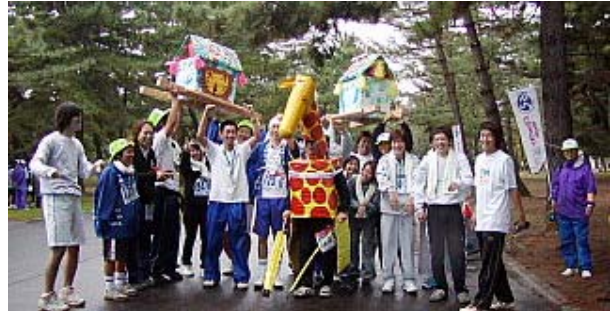
私たちがベストコスチューム賞をいただきました。