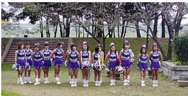
恒例の聖和大学のチャリダー