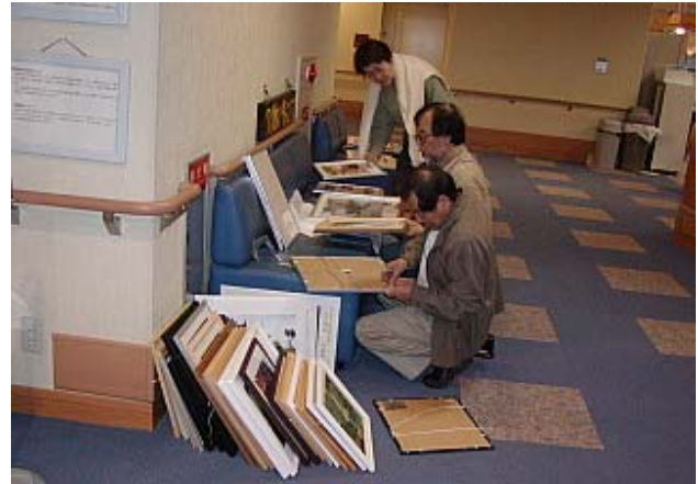
写真の展示準備をする会長と実行委員長

素晴らしい写真ばかりです。是非サンホームにお出でいただいて皆様の力作をご鑑賞ください。