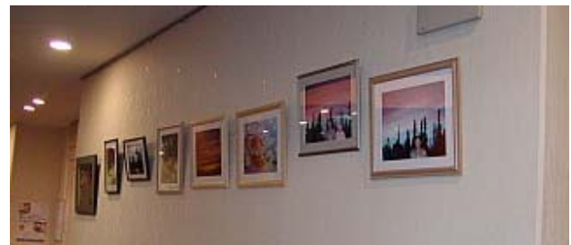
実物をご覧下さい。