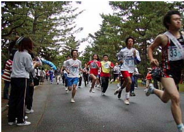
元気にスタートする参加者