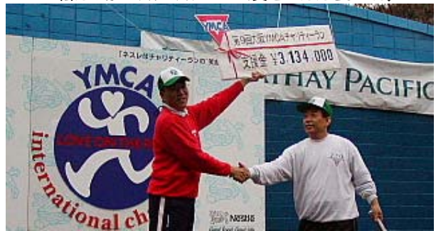
感謝いたしますと錦織総主事