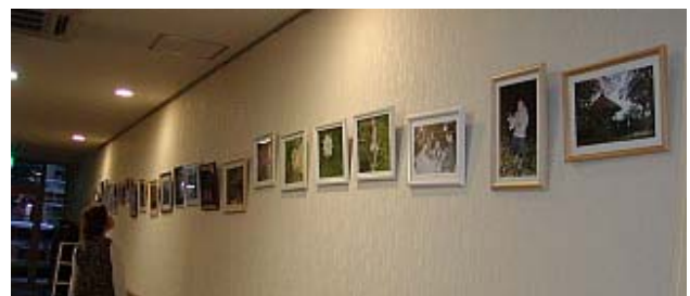
ウーン 素晴らしい!!