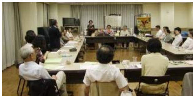
格安での中国旅行を有難うございました。 現物と写真での旅行でした。