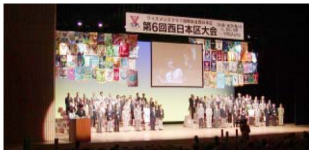
西日本区クラブ会長の勢揃い