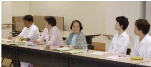
熱心にお話を聴く参加者