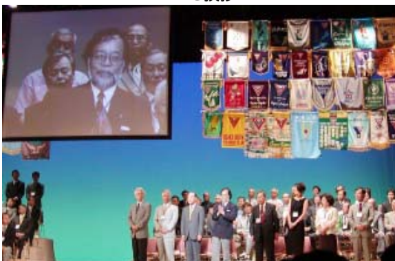
バナーセレモニー