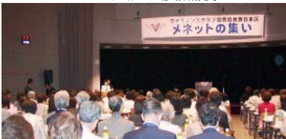
熱気ムンムンのメネット会風景