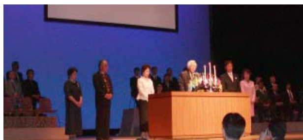
厳粛な理事引継ぎ式