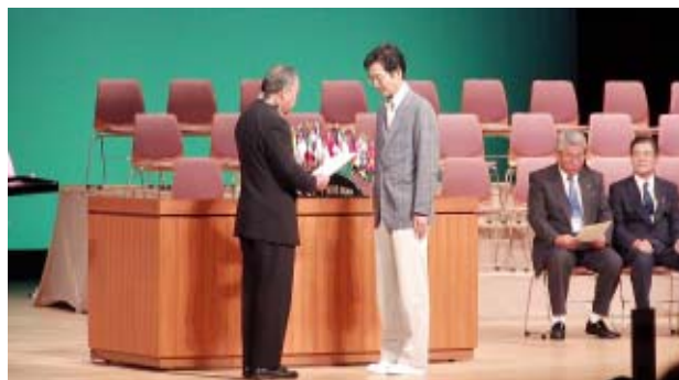
表彰される児玉会長（いいなあ～）