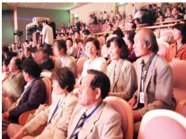
客席のクラブメンバー