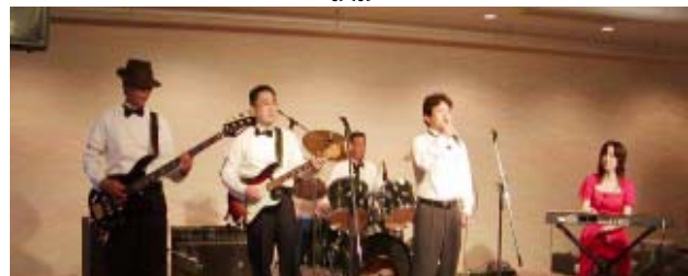
フェロシップアワー