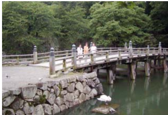
チョットさぼって 彦根城見学